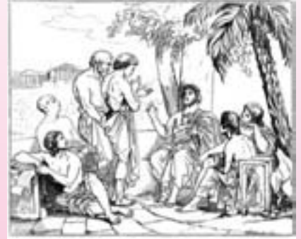
“Platonik aşk” kavramı, içeriğinde cinsellik barındırmayan sevgi ve aşk anlamı taşıyor. Ancak bu betim, çoğu kez Platon’un, güzellikle birbirine bağlanan âşıkları bilgelige iten bir his olarak “aşk” hakkındaki görüşleriyle karıştırılabiliyor. Dolayısıyla, platonik aşkla, Platon’a göre aşkı birbiriyle karıştırmamak gerek.

bağlılık ve dostluğa bırakarak fiziksel çekimlerin önemini gitgide arka planda bırakıyor. Yaşlılık döneminde eşlerin biyolojik olarak üretkenliği tükenmiş olduğundan, enerjinin cinselliğe aktarılmasından çok ilişki, şefkat ve fedakârlık boyutunda birbirine destek tabanlı ilerlemeye başlıyor.